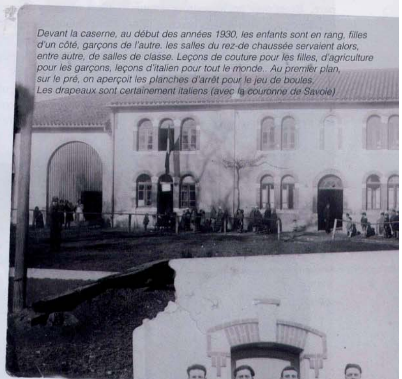
Devant la caserne, au début des années 1930, les enfants sont en rang, filles d'un côté, garçons de l'autre. Les salles du rez-de chaussée servaient alors, entre autre, de salles de classe. Leçons de couture pour les filles, d'agriculture pour les garçons, leçons d'italien pour tout le monde. Au premier plan, sur le pré, on aperçoit les planches d'arrêt pour le jeu de boules. Les drapeaux sont certainement italiens (avec la couronne de Savoie)

C'est à l'initiative de l'Église et du gouvernement de Mussolini que le projet de fonder une colonie italienne en pays étranger voit le jour, projet mené pour éviter de perdre à la fois le corps et l'âme des nombreux candidats à l'exil. En ces temps mouvementés et difficiles pour l'Italie, une émigration massive se dessine mais ne valorise pas l'image du Fascisme, déjà bien installé. Voilà pourquoi on décide et programme une émigration collective, qui aurait pour enjeu de maintenir l'identité italienne des exilés, ainsi protégés du « matérialisme » sans foi ni loi qui inonde la France. Une colonie dirigée par un « bon catholique » issu des « bonnes familles » de