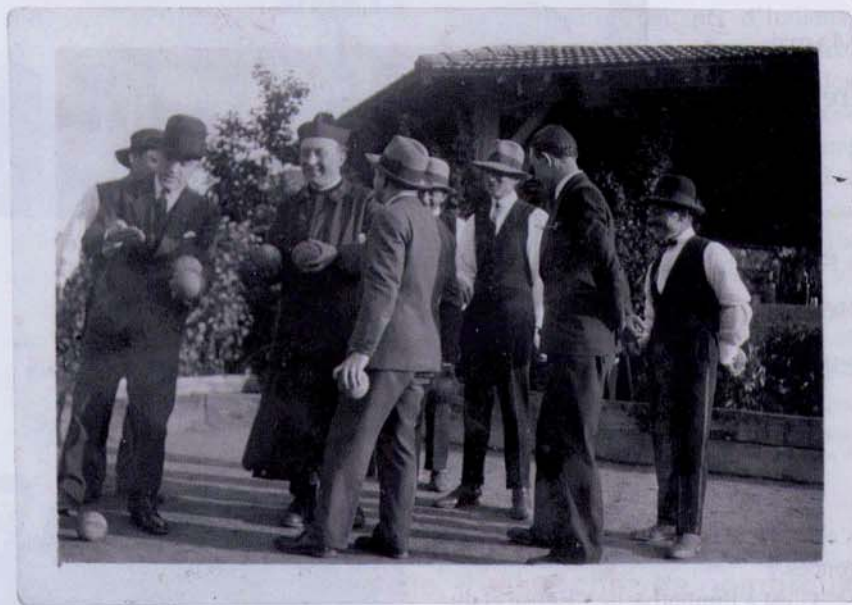
Années 30 : le jeu de boules à la lyonnaise, un dimanche après la messe, avec en fond le manège à chevaux du temps où la caserne, avant la guerre de 14-18 était occupée par la cavalerie.