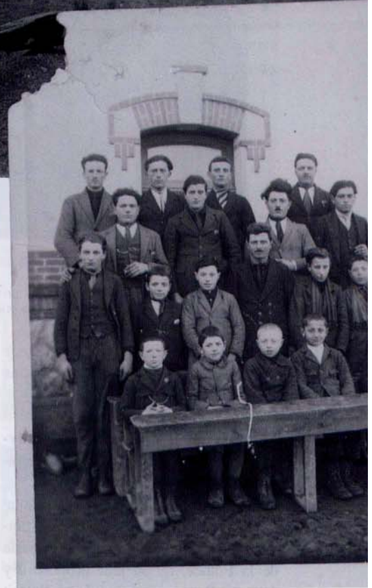
Les "maschile", jeunes gens du village toujours dans ces mêmes années 30.